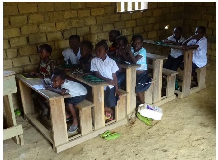
gleiches Zimmer 2017 mit den neuen Bänken

Weitere Ausbau- und Verbesserungswünsche in der Primarschule Makanga