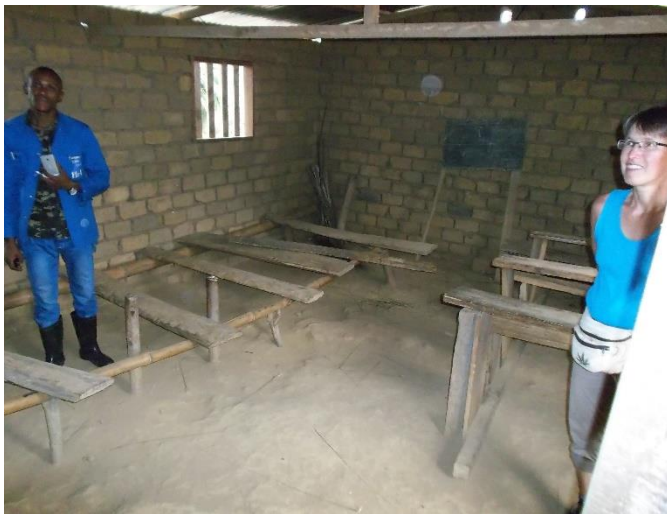
Schulzimmer der 1. Klasse 2015